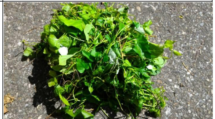
將小花蔓澤蘭放置水泥地曬乾