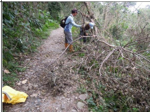
移除影響步道通行安全之倒木及樹枝