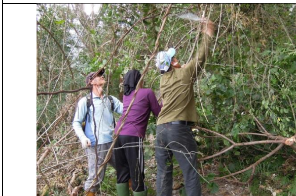
移除影響步道通行安全之倒木及樹枝