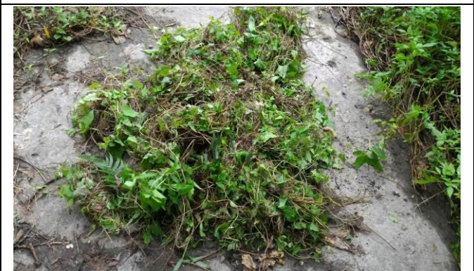
將小花蔓澤蘭放置空曠地曬乾