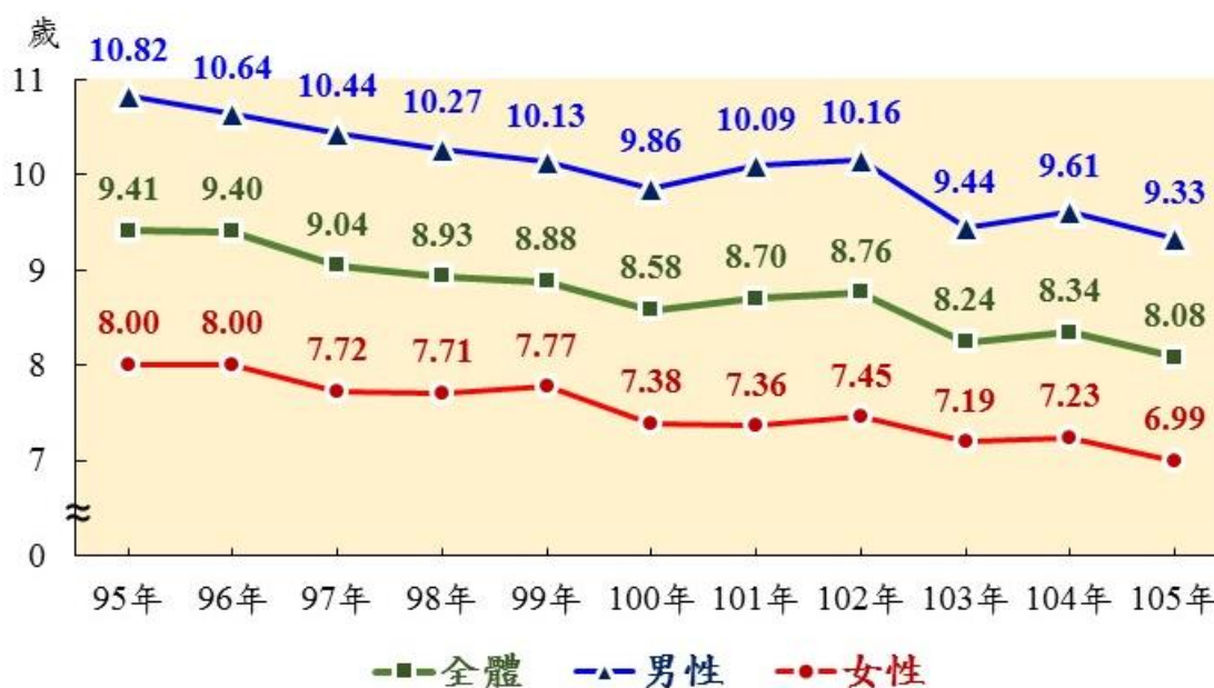
圖2 歷年原住民與全體國民零歲平均餘命之差距