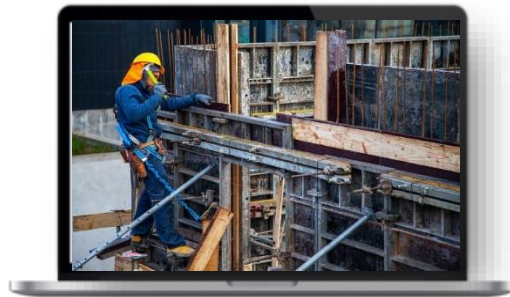
未維護工作防護器具妥善