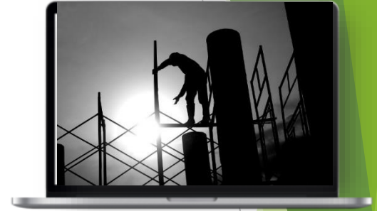
未提供合規、安全之工作環境