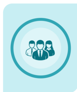
找團體 (含地址異動)