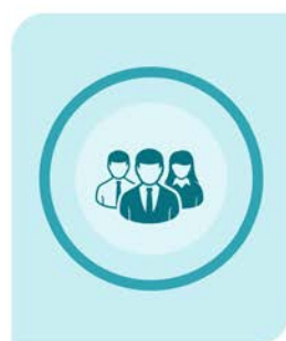
找團體 (含地址異動)