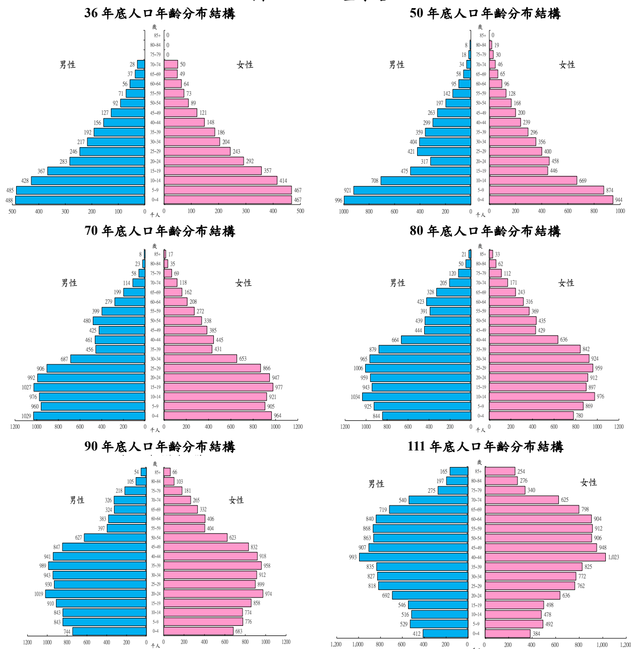
圖 1-2 人口金字塔