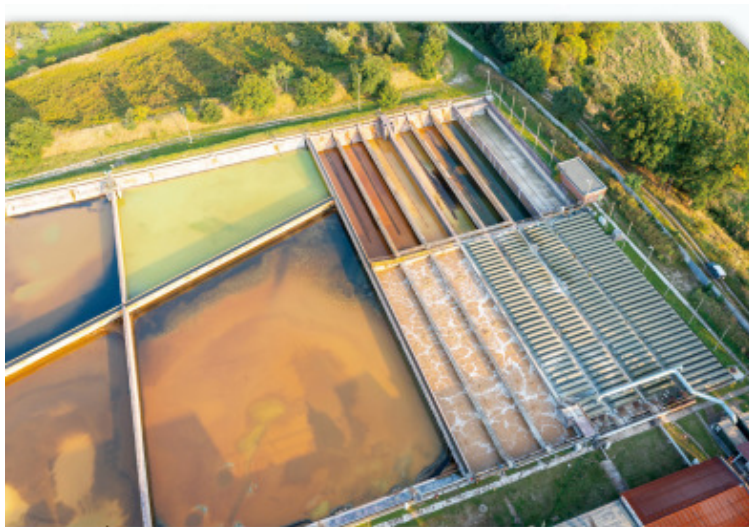
駭客攻擊試圖篡改水設施的管控系統，將主要用以減少水中病原體、礦物質或其他污染物的微量化學物質過量添加，此舉恐將對人體造成嚴重危害。

2021年2月佛州奧爾德斯瑪市水設施遭駭客攻擊後，美國網路安全和基礎設施安全局（Cybersecurity and Infrastructure Security Agency, CISA）、環境保護局（Environmental Protection Agency, EPA）、聯邦調查局（Federal Bureau of Investigation, FBI）及國土安全部（Department of Homeland Security, DHS）等單位針對水設施，提供以下三個面向的安全準則：