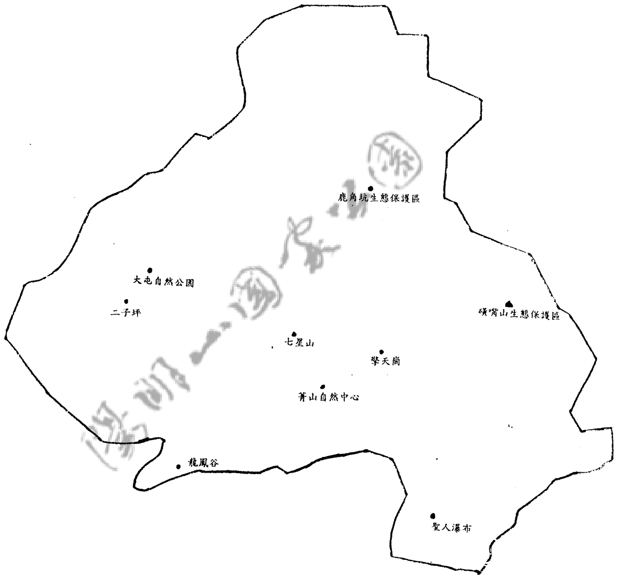
圖一、陽明山國家公園昆蟲資源調查之研究地點分布圖