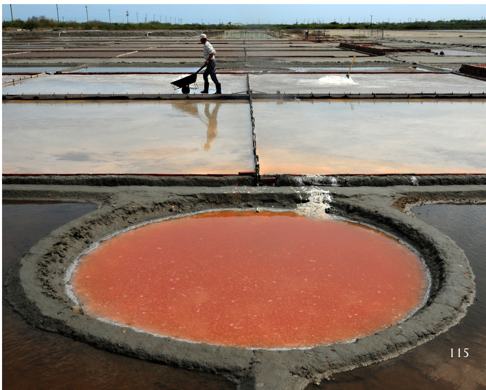
安順鹽田

年臺南科技工業區動工，安順鹽田正式停止曬鹽，鹽田經濟壽命約 75 年；爾後由文建會補助成立「鹽田生態文化村」，推動鹽業文化保存與社區營造；2009 年台江國家公園成立，遂納入國家公園範圍內。