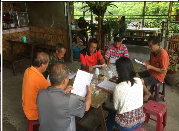
項目：狩獵訪問 說明：在天狗部落作狩獵訪問說明會