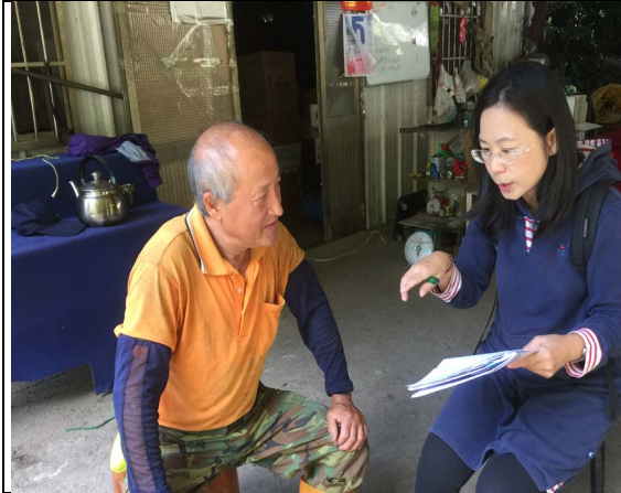
項目：狩獵訪問 說明：柯O憲是天狗部落獵人