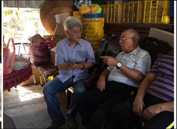
項目：拜訪部落 說明：柯O原是天狗、梅園兩部落的大頭目