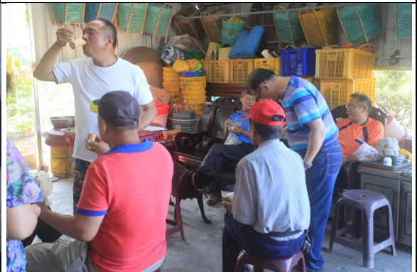
項目：參加祖靈祭 說明：一桶小米酒，由參與的人輪流喝完