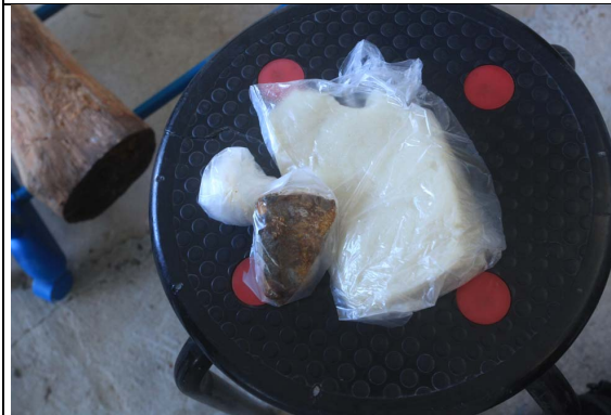
項目：參加祖靈祭 說明：以年糕及鹹魚分享給參與者