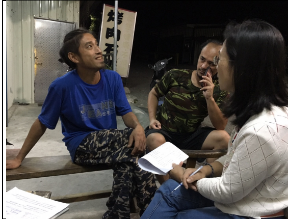
項目：狩獵訪問 說明：賴O緯是部落較常狩獵的獵人