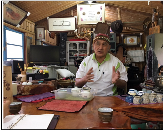
項目：狩獵訪問 說明：高O盛是梅園部落耆老