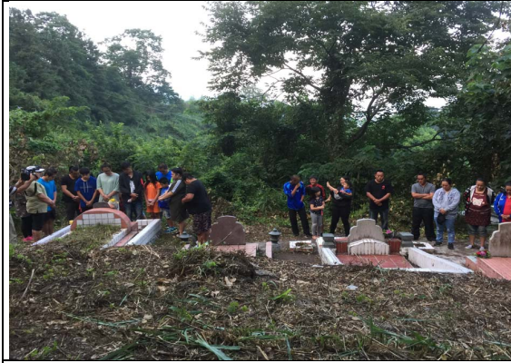
項目：參加祖靈祭 說明：祖靈祭現場