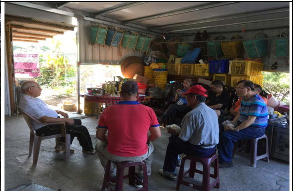
項目：參加祖靈祭 說明：祖靈祭結束，部落中的耆老齊聚頭目家