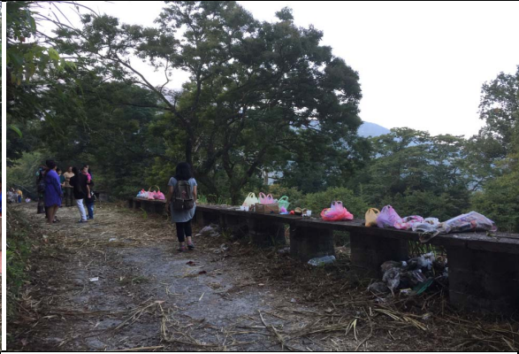
項目：參加祖靈祭 說明：泰雅族的祖靈祭，祭物以少代表多