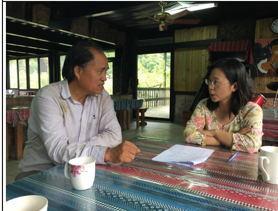
項目：狩獵訪問 說明：賴O雄是梅園部落有智慧的長者