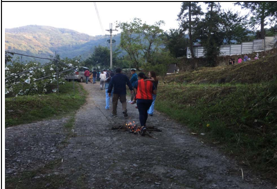
項目：參加祖靈祭 說明：祭祖結束的過火儀式