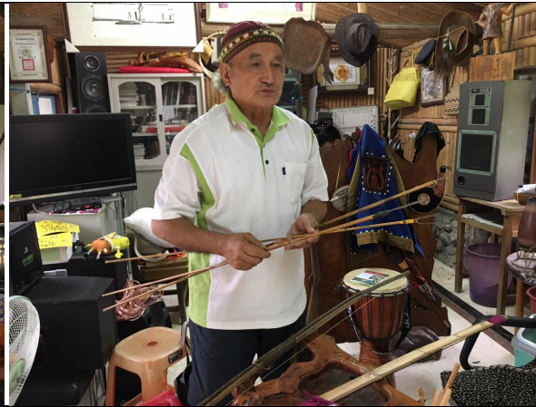
項目：狩獵訪問 說明：耆老展示舊時狩獵工具