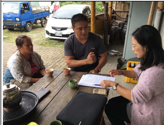
項目：狩獵訪問 說明：鄭O泰是部落會議青年組長