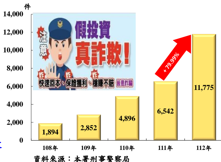
近 5 年投資詐欺犯罪件數

面對詐欺案件犯罪型態與技術不斷演化，行政院於 112 年上半年推動修正「打詐 5 法」，同年 7 月核定修正「新世代打擊詐欺策略行動綱領 1.5 版」，從「識詐、堵詐、阻詐、懲詐」4 大面向積極打詐，整合各部會力量，強化截堵技術與健全法律制度，以減少詐騙受害案件。警方持續透過媒體通路，分齡分眾進行防詐宣導，並聯合金融機構針對投資族群精準投放宣導資訊，強化全民識詐知能。茲就 112 年詐欺案件概況簡析如下：