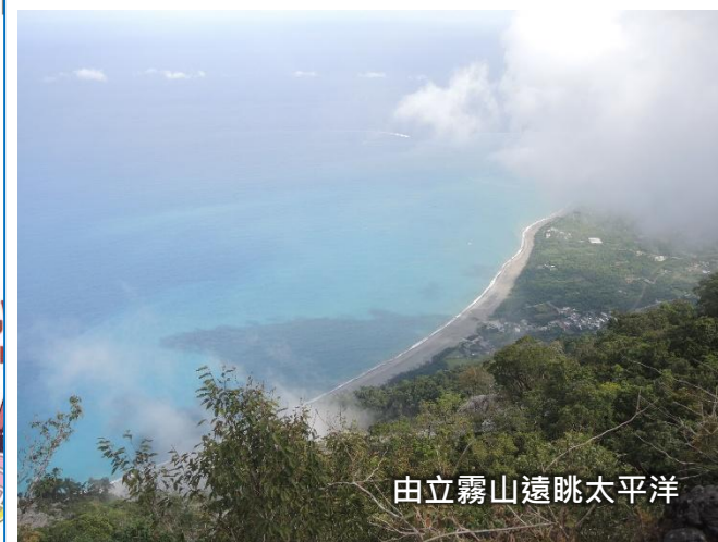
由立霧山遠眺太平洋