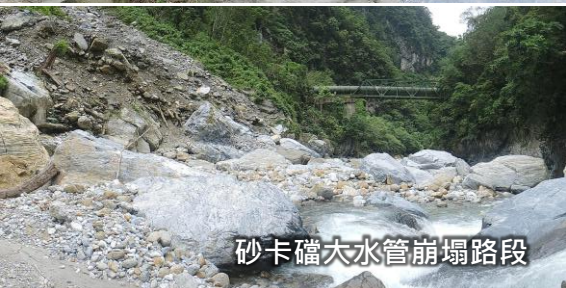
砂卡礫大水管崩塌路段