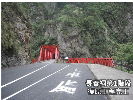
長春祠第1階段 復原工程完工