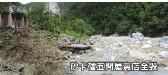
砂卡礑五間屋賣店全毀