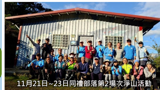
11月21日~23日同禮部落第2場次淨山活動

得卡倫步道與大禮大同林道災修工程完工，同禮 部落於暑假開放，立霧山於12月4日開放