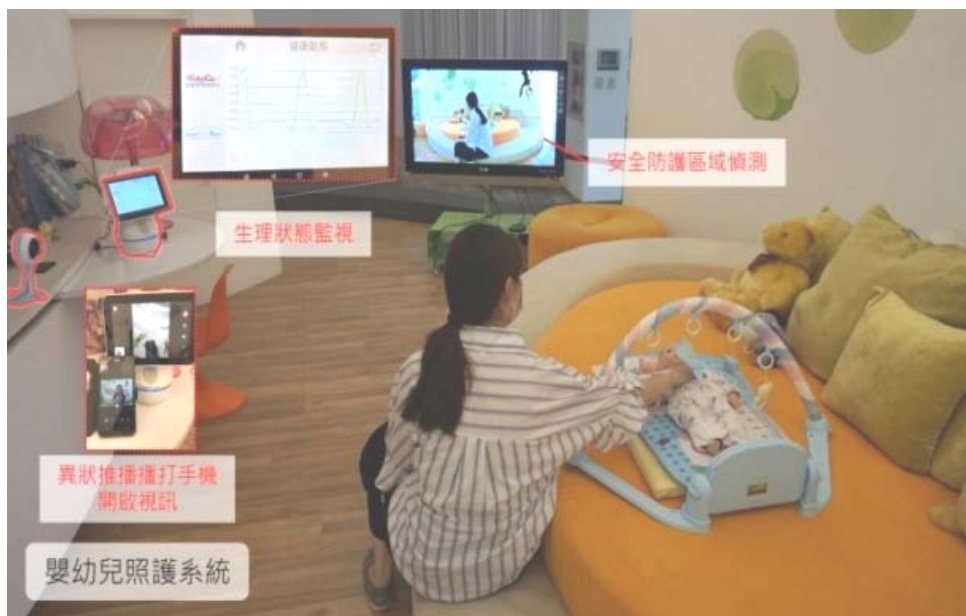
圖 1 住家導入適當智慧科技可減輕兒童照顧者的照顧負擔

內政部建築研究所依據行政院科技政策，推動智慧化居住空間科技發展，以提升國民居住環境品質，帶動我國具國際競爭優勢之ICT產業升級發展。98年於臺北市文山區建置智慧化居住空間展示中心，提供國民、外賓及國內、外建築師等專業從業人員實際體驗智慧化居住空間之實體場所，並依據內政部為中央建築主管機關之職掌，透過分析如：兒童照顧者之日常使用需求與期望，所描繪住家兒童照顧之應用情境，說明如何導入適當之智慧科技以減輕兒童照顧者照顧負擔(圖 1)、輕鬆在家線上學習等展示內容，以輕鬆自然之方式，向參觀者介紹智慧化居住空間科技的理念與技術。