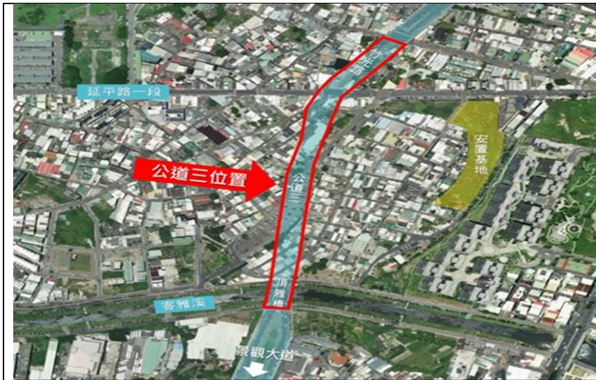
公道三（竹光路延伸銜接至景觀大道） 新闢道路工程位置示意圖