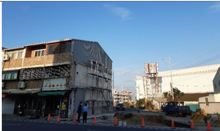
配合道路開闢而拆除建物，給予補償及適合配地