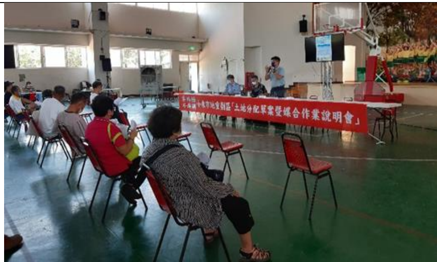
配地草案暨 媒合作業說 明會