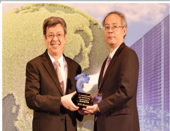
103年資訊月百大創新產品獎 —公共服務類創新產品