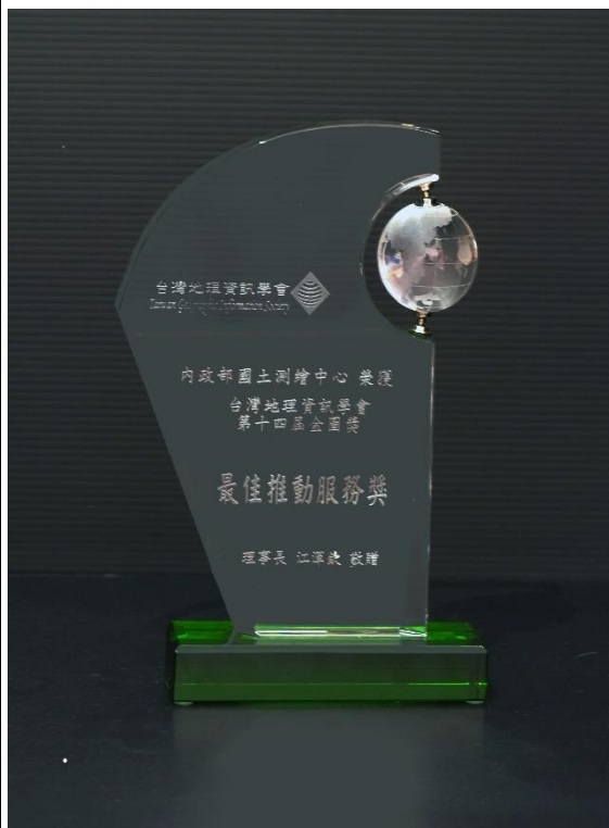
107年再獲「第14屆金圖獎－最佳推動服務獎」