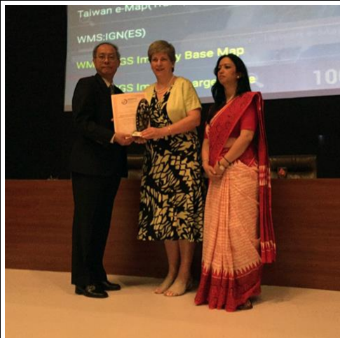
第10屆金圖獎—最佳應用系統獎