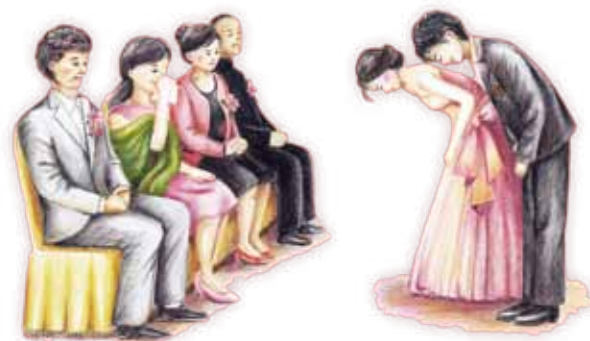
新人感謝雙方父母、平等成家

為什麼傳統訂婚時，男方要致送聘金給女家？ 為什麼傳統結婚時，新娘要拜別父母？ 傳統婚禮習俗有其時代背景及成因，隨著社會變遷婚俗也應順應時代重新詮釋與調整。 若能了解原初的意涵，再思考現代婚禮的意義與需求，便可求新立意又不失溫馨隆重。