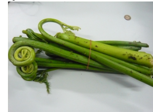
圖四、瓦氏鳳尾蕨的嫩葉，是當地居民的野菜，也是降血壓的良藥。