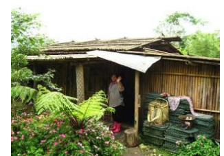
圖五、筆筒樹做為竹屋的柱子。