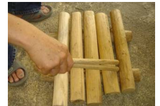
圖七、木油桐製成的木琴。