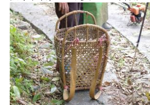
圖六、太魯閣族的背篋以黃藤皮製成，堅固耐用。