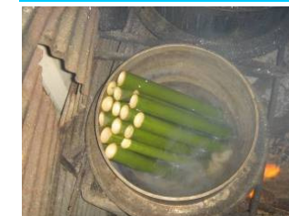
圖二、竹筒飯是太魯閣族傳統食物之一。