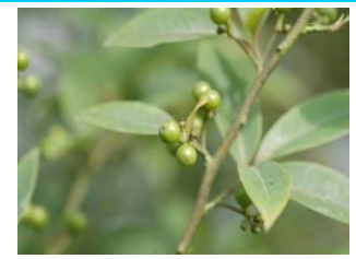
圖三、山胡椒被當作調味料，也是重要經濟作物。