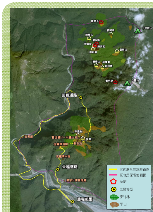
圖1 同禮部落位置圖

太管處陸續委託了生態旅遊細部規劃案，砂卡礑及大禮大同地區生態旅遊行動計畫之研究，生態旅遊整體規劃研究，以及大禮大同地區生態旅遊遊程之規劃研究；以跟著獵人走一日擊式狩獵活動為例，及培訓原住民解說人員，企劃以一日體驗為主的生態旅遊活動。