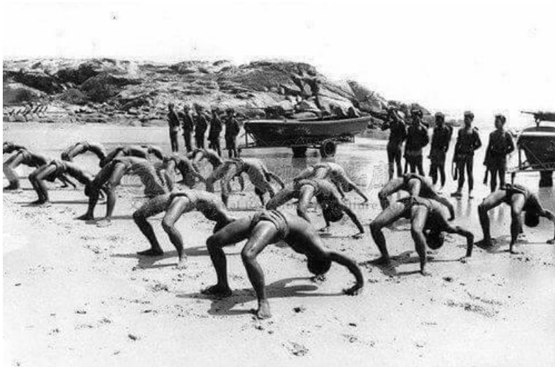
(上圖為楊○雄先生於海龍受訓時的照片)