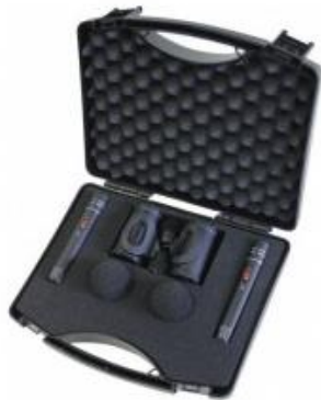
beyerdynamic 電容式指向性麥克風 MC 930 Stereo-Set x2