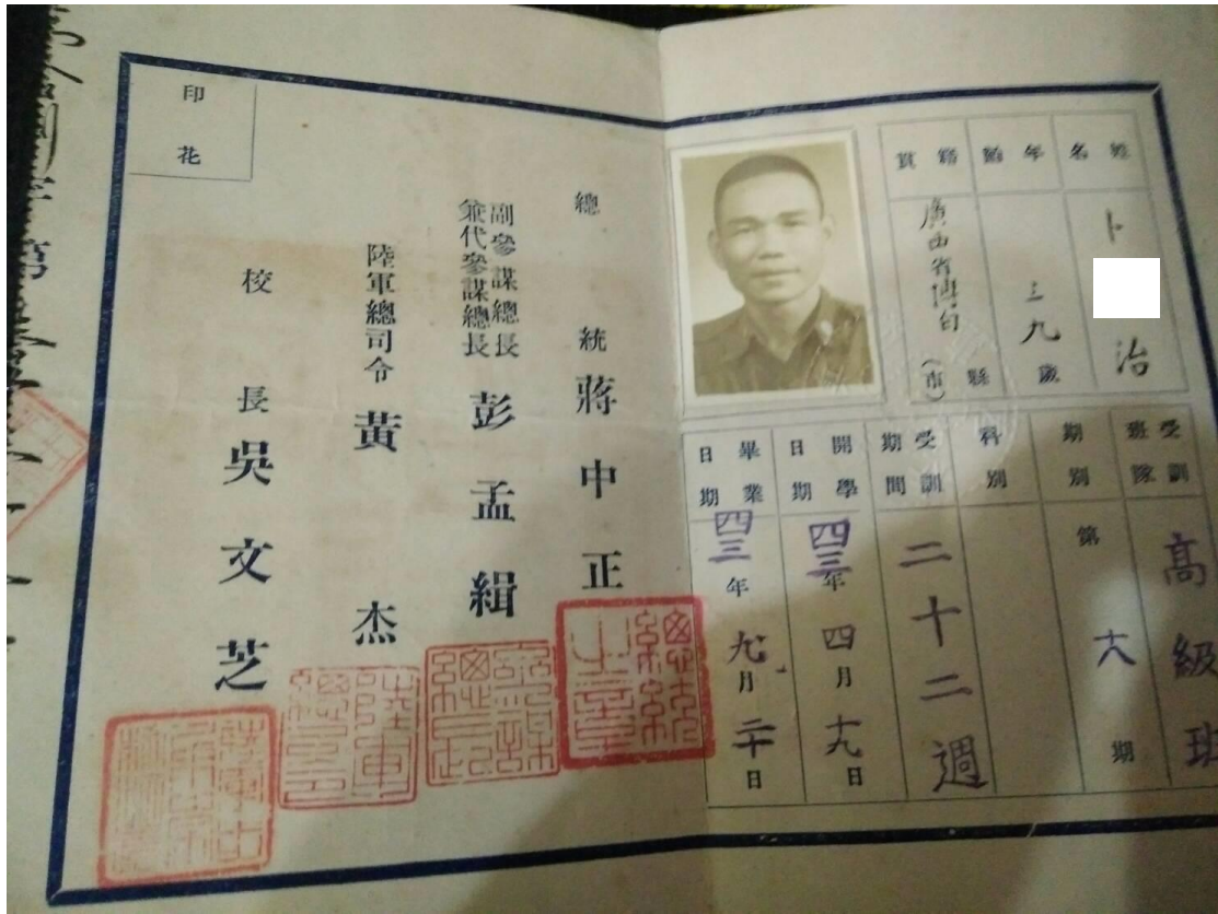
(上圖為卜O治先生之軍官結訓證書)