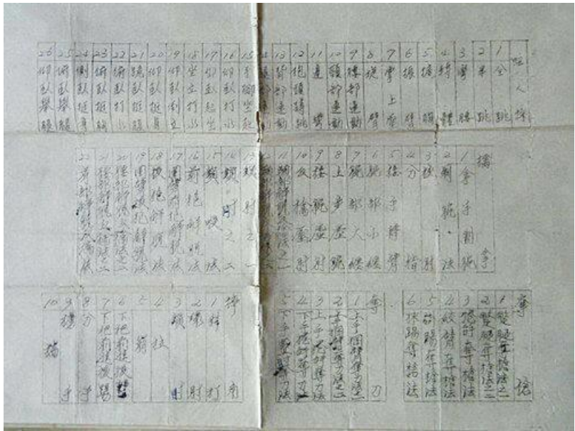
(上圖為楊○雄先生服役時之操課表)