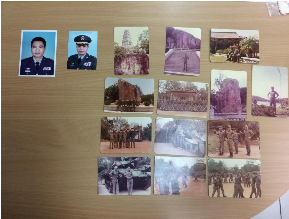
(上圖為莊○亮將軍服役時之照片 15 張)