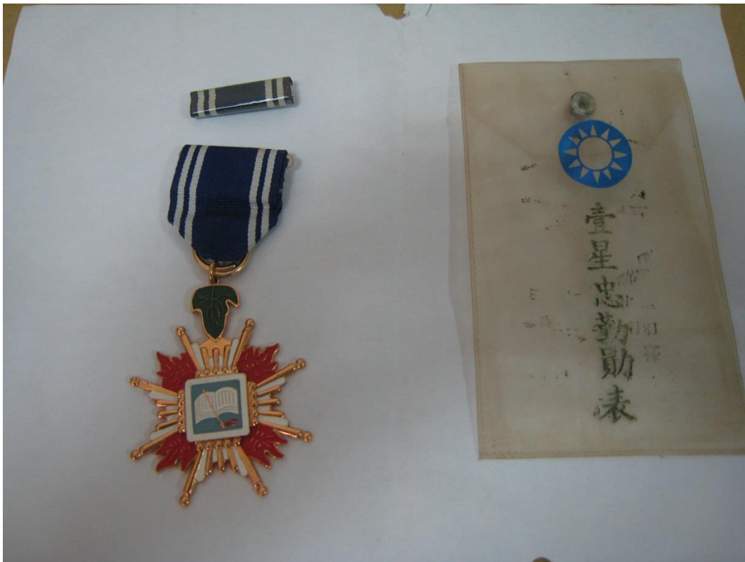
(上圖為胡O遠先生的壹星忠勤勳章)