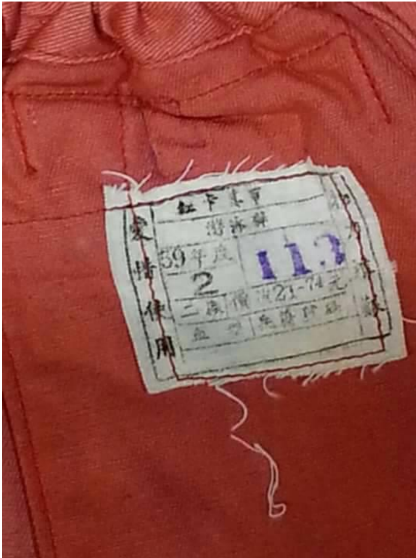
(上圖為楊○雄先生服役時之海龍蛙兵紅短褲)