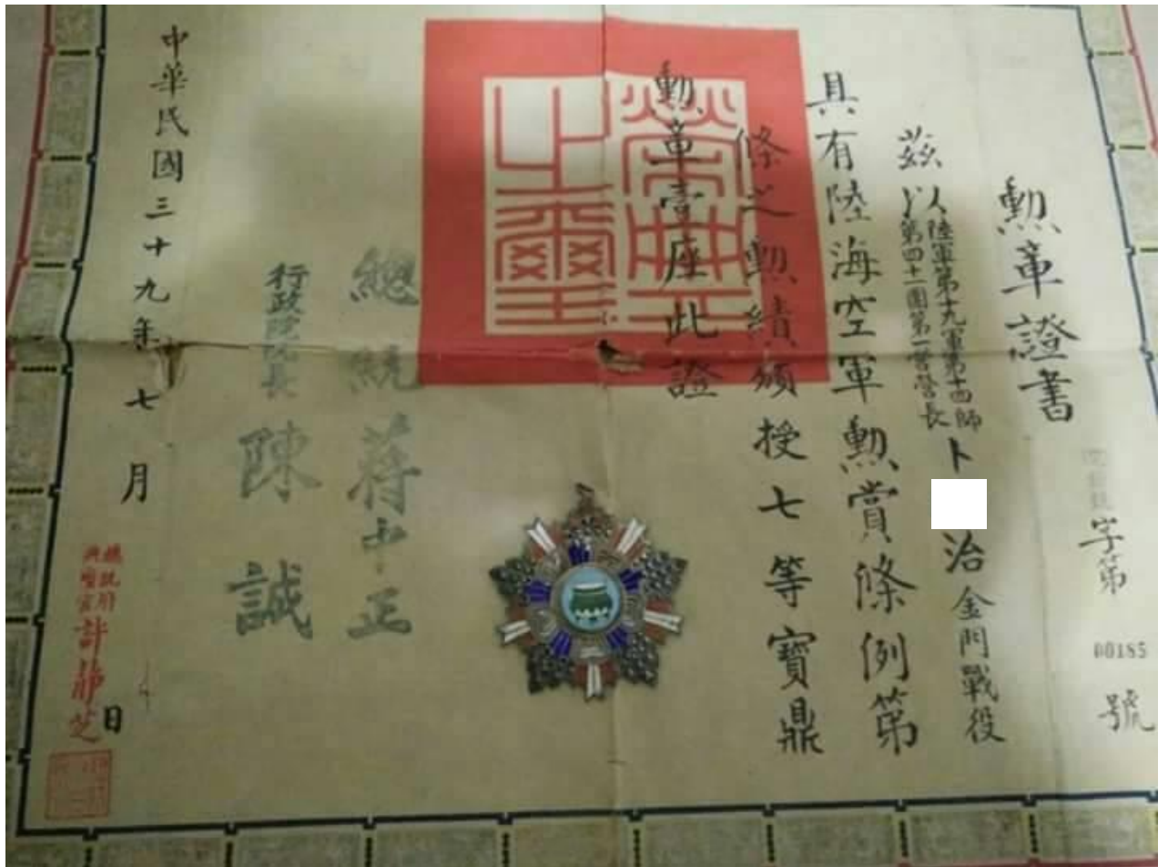
(上圖為卜○治先生獲頒七等寶頂勳章)