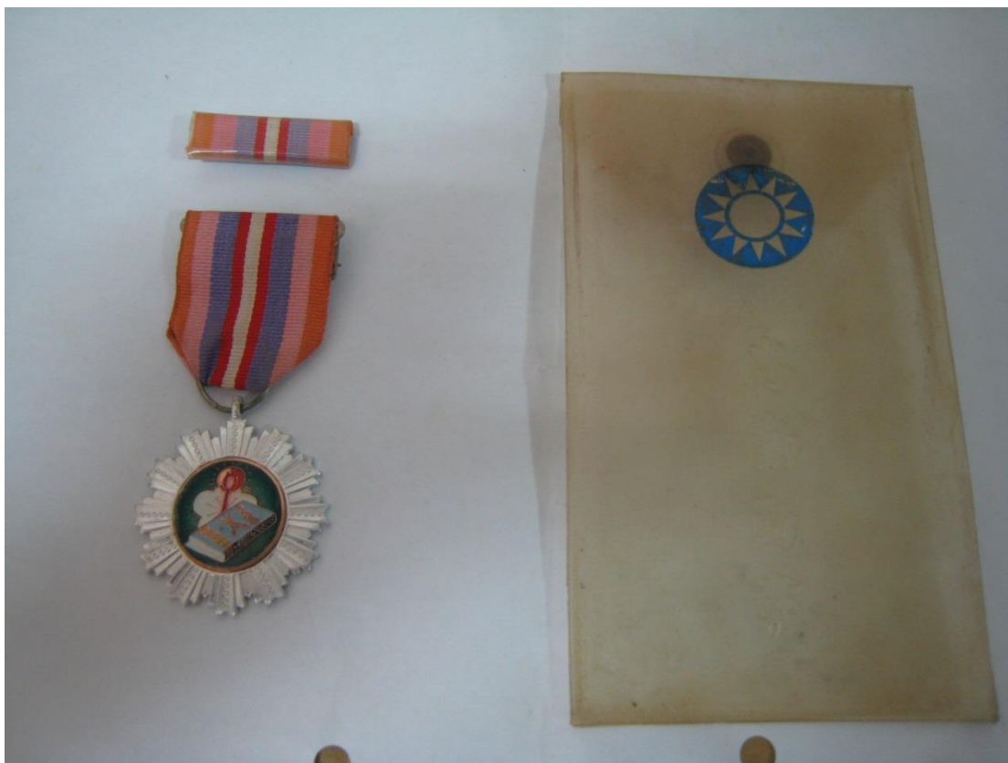
(上圖為胡○遠先生的景風乙種勳章)