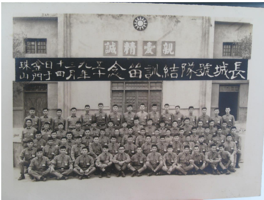
(上圖為胡○遠先生的長城號結訓留念照片)