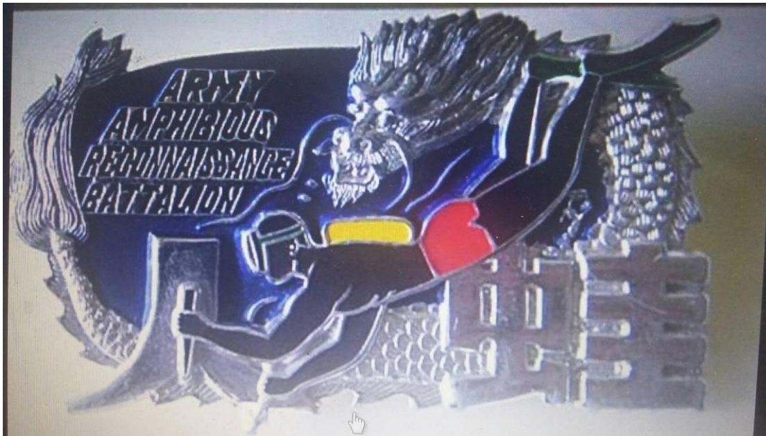
(上圖為楊○雄先生服役時之海龍蛙兵名牌)