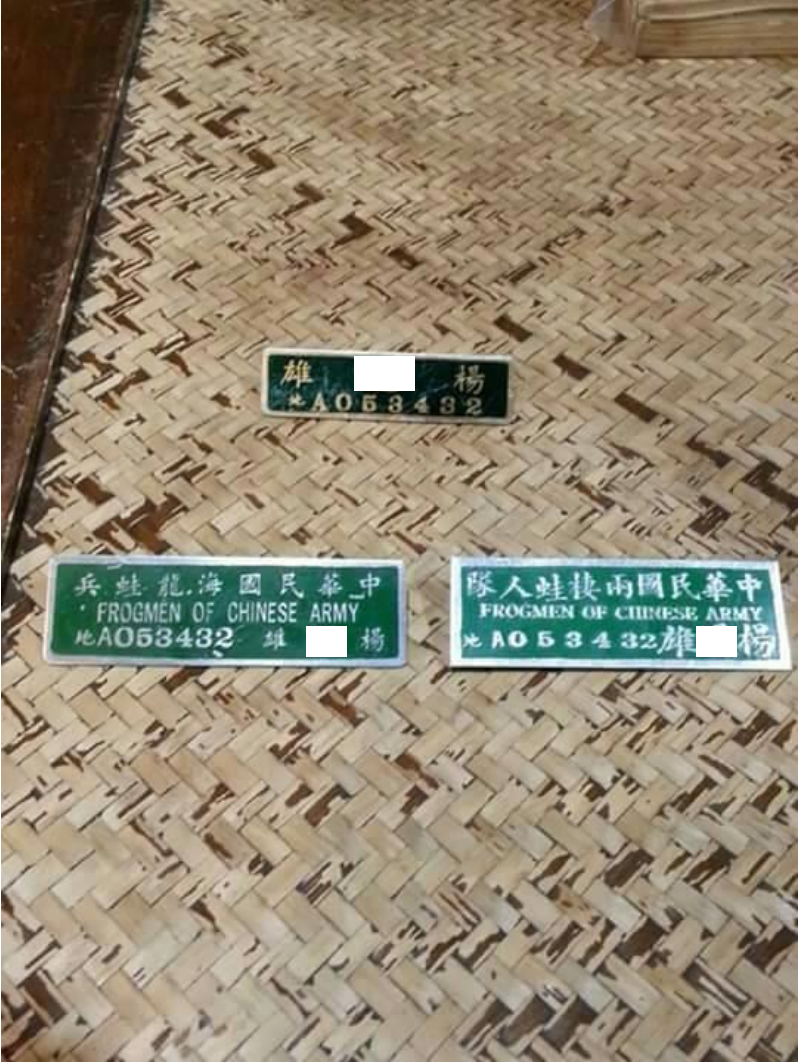
(上圖為楊○雄先生服役時之名牌)