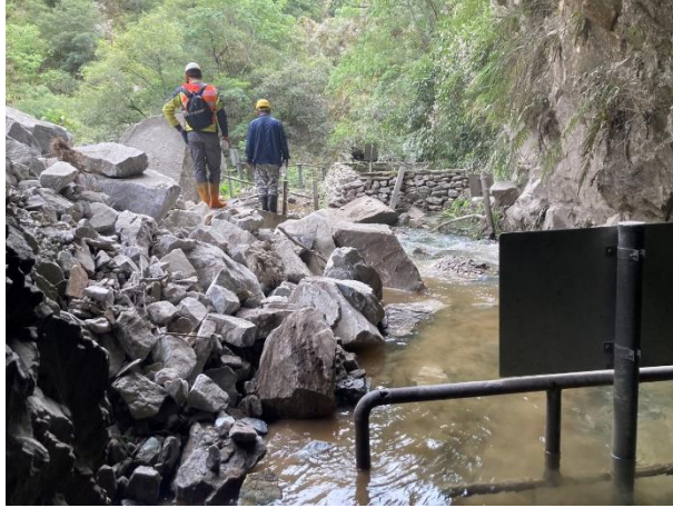
/水簾洞口前邊坡坍方土石堆積