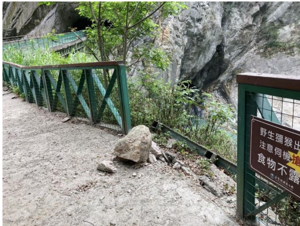
/往白楊吊橋落石與損毀護欄