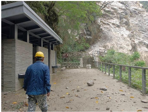
/水簾洞公廁前土石散落一地