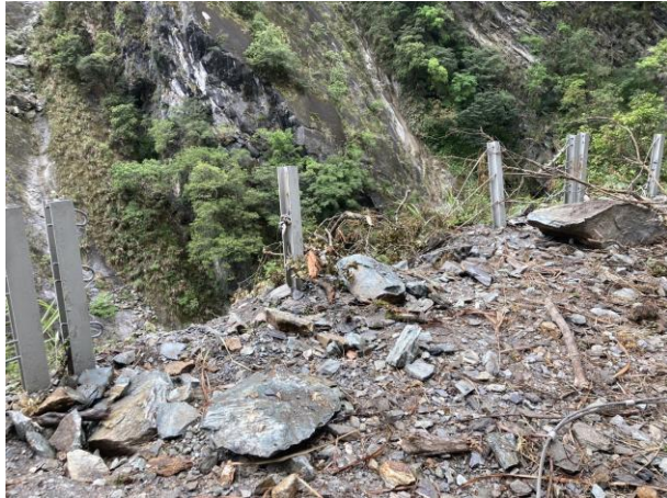
/1.8k 多處邊坡落石散佈路面