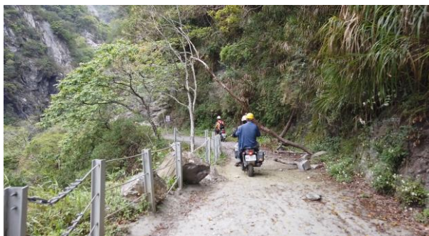
/1.45k 落石毀損護欄與樹木傾倒