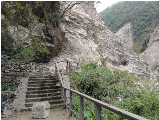
/往水簾洞階梯巨石