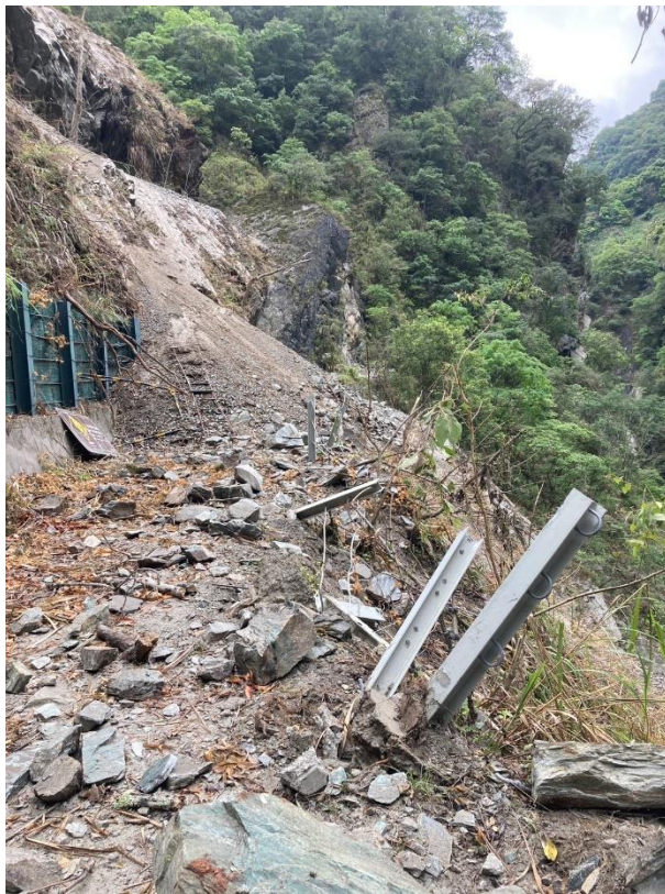
/1.85k 邊坡落石護欄大規模毀損