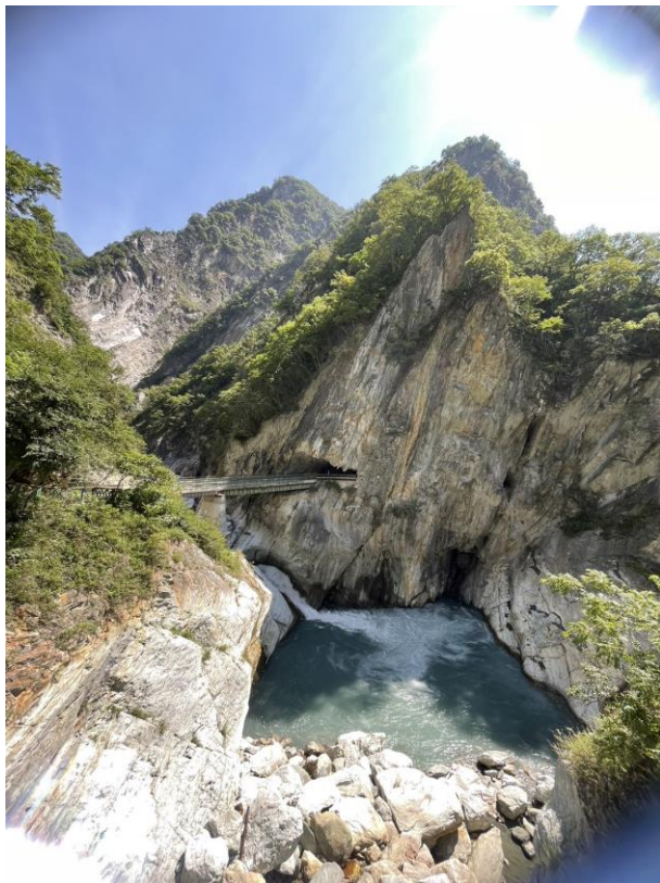
/6 月的白楊水泥橋與下方深潭