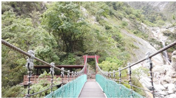
/白楊吊橋無明顯損傷