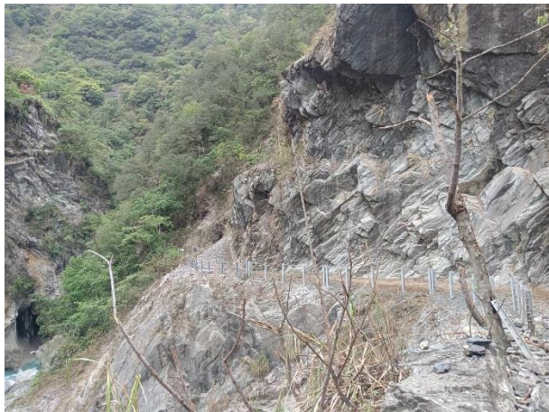
/步道因山崩產生暴風吹落步道沿 線樹木葉子