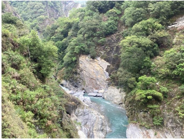
/1.6k 崩壁處對岸岩盤滑落