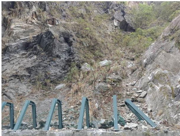
/1.8k 山溝擋落石鋼製格柵損毀