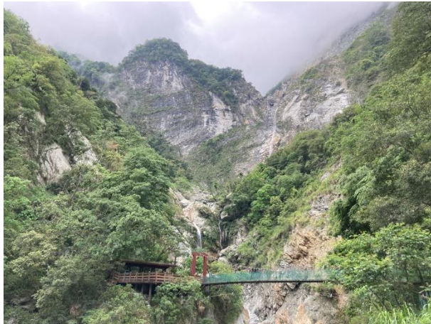
/白楊瀑布尚無異常