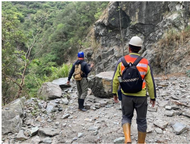
/1.8k 多處邊坡大型落石