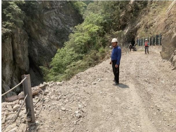
/沿途石塊土堆清除