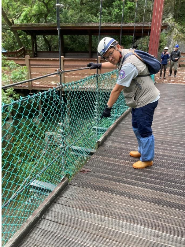
/白楊吊橋橋面邊緣破損