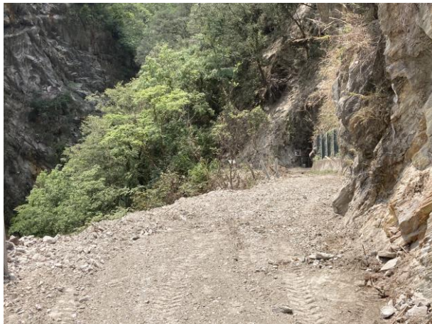
/沿途石塊土堆清除