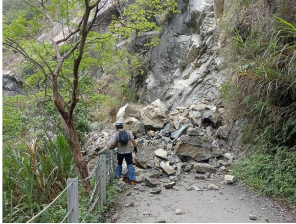
/1.8k 邊坡落石步道阻斷