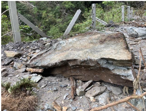
/1.8k 多處邊坡大型落石