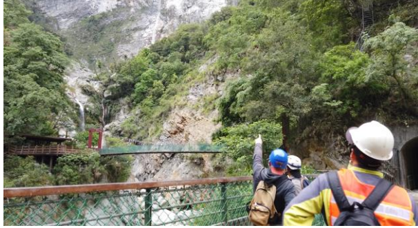
/白楊瀑布尚無異常