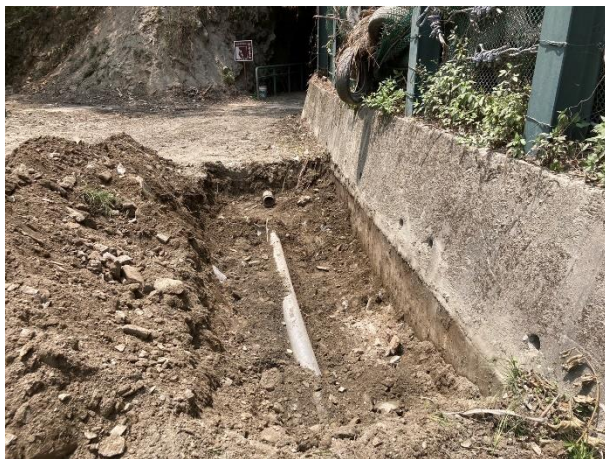
/1.85k 修復天祥取水管線