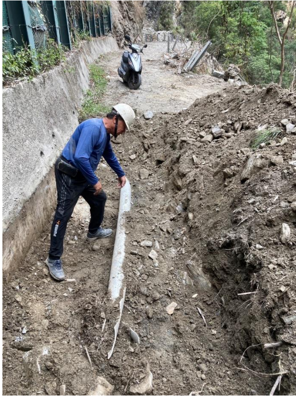
/修復天祥取水管線