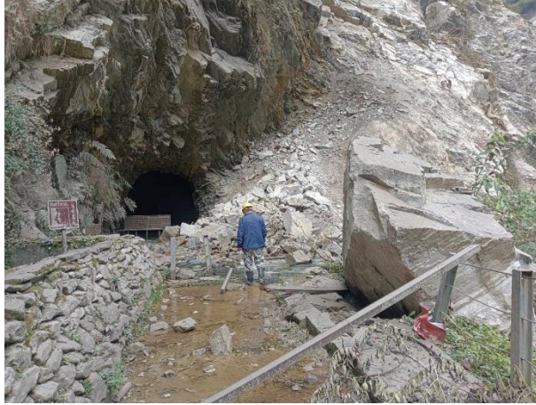
水簾洞前巨石毀損圍欄路面、取水口和邊坡滑落情況