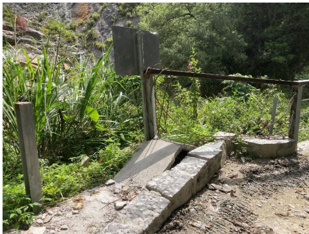
水簾洞口路緣突起