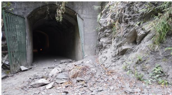
/1k 第二隧道入口邊坡土石滑落