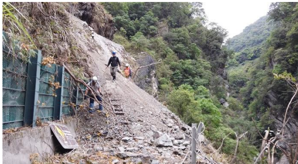
/1.85k 邊坡坍方路面土方堆積