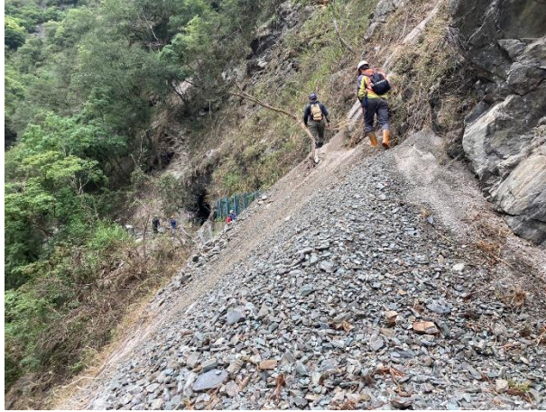
/1.85k 邊坡坍方路面土方堆積