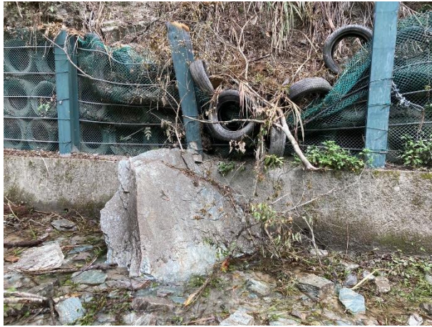
/1.85k 石塊砸損天祥取水管線