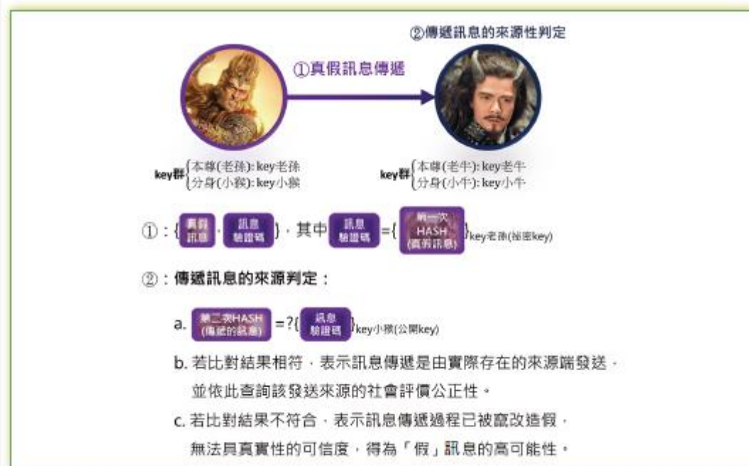
圖 1 PK 系統與 HASH 的搭配處理

另外訊息傳遞的第二個情形是，權責單位的確發布事實訊息，但發布的訊息被蓄意先下架，內容遭竄改後，例如把褒獎令的內容改掉，再進行發布。此情形裡，發布的權責單位是對的，但是內容是被改過的。但是在這一個過程中加上一個 HASH，就可以把這問題爭議處降到最低，因為依照所提到的密碼技術概念，HASH 這武器可清楚證明訊息是否被造假竄改。例如，若今天褒獎令的訊息裡有相關人物數量的名額是「10」位，被修改成「9」位，就會發現所傳遞褒獎令的訊息經第二次 HASH 的運算後會很不一樣，所以搭配 PK 的 HASH 也是解決假訊息的關鍵技巧之一。