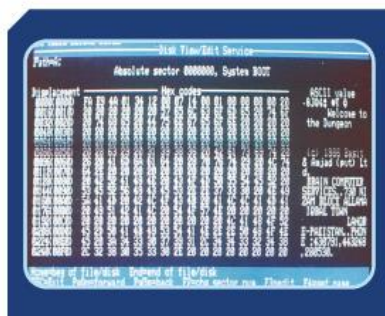
1986年，巴基斯坦人製造出Brain病毒程式，此病毒會感染開機磁區，影響電腦正常運作。

再則，我們來到被動者接受訊息的第二種型態，那就是多媒體訊息。多媒體訊息在資安領域裡，是有別於密碼學（cryptography）的，我們稱為偽裝學（steganography），兩者最大不同在於「偽裝」二字，即「有看沒有懂」，亦即英文「Seeing the unseen」。以大自然生態為例，許多動植物都是偽裝專家，就像變色龍般，能隱藏於樹叢枯枝中，然後隨著綠葉枯樹的色澤而進行調