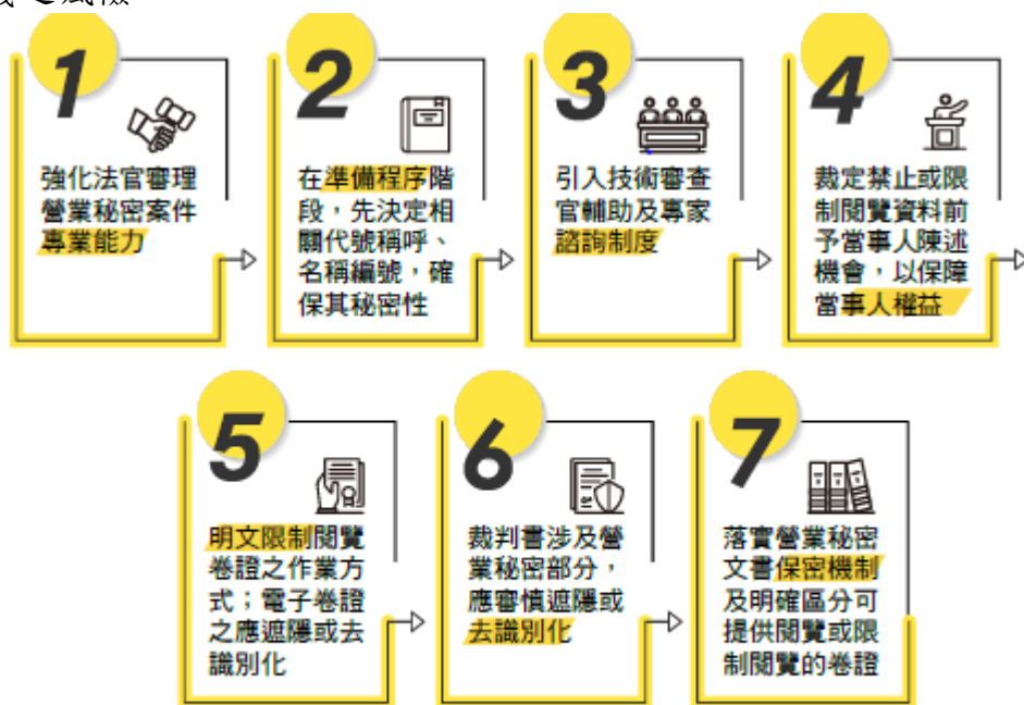
圖 1 《地方法院辦理營業秘密案件應行注意事項》重點摘要

此外，司法院同步修訂《法院辦理「秘密保持命令」及「偵查保密令」案件作業要點》，修改卷證提出、閱覽及調查方式等相關規定，以防止營業秘密因提出於法院導致外洩之風險。