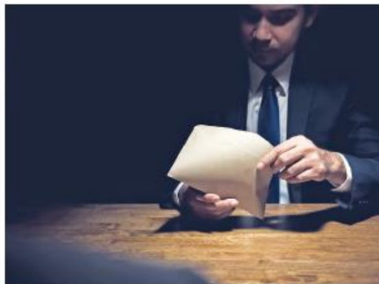
我國於 109 年修正公布《國家情報工作法》部分條文，如從事間諜行為最重可處無期徒刑並終身追訴，同時也提高罰金。