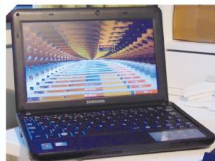
「木馬」是一種後門程式，駭客用其盜取使用者的個人訊息，甚至進行遠端控制。