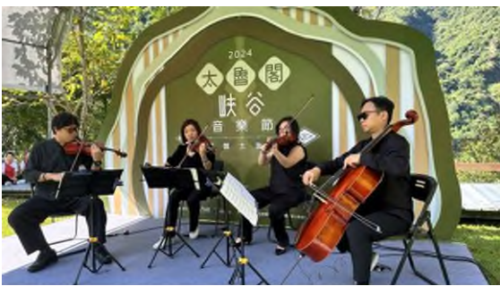
國家響樂團將於峽谷音樂節中演出

太管處表示，今年安排 2 輛綠能公車加入接駁車的行列，活動宣傳也不懸掛路燈旗，也希望藉活動傳達「減碳」的理念。由於活動當天太魯閣臺地從上午 8 時至下午 6 時將進行交通管制，禁止汽、機車進入，大家可以搭火車、公車或開車到新城車站轉搭接駁車。太管處也特別提醒大家，11 月 9 日請大家自備水杯(瓶)，也可以攜帶地墊、遮陽帽及備用雨具，到太魯閣臺地享受 1 天的太魯閣峽谷音樂饗宴喔！