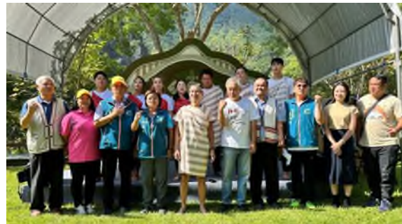
太魯閣峽谷音樂節將於 11/9 登場