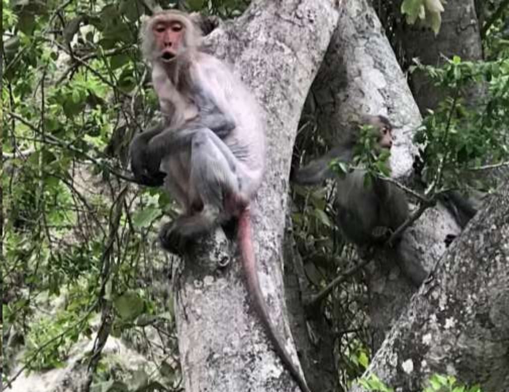
110年8月3日天祥上福園大欖木