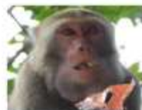
哈貝兩面 (公, 成猴)