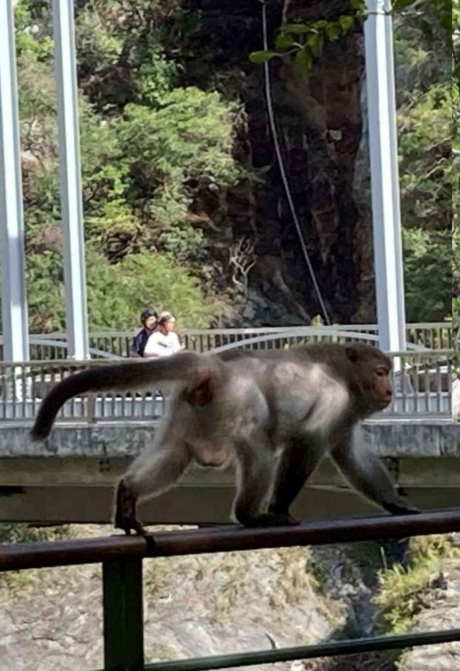
109年8月23日天祥下福園