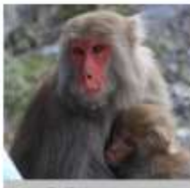
凸凸(母, 成猴) 小痔媽