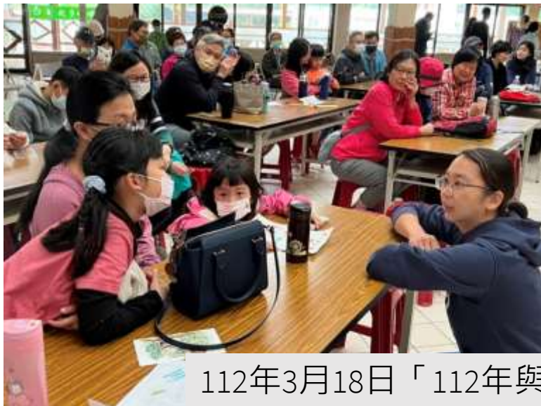
112年3月18日「112年與天祥有約-天祥猴厝邊」