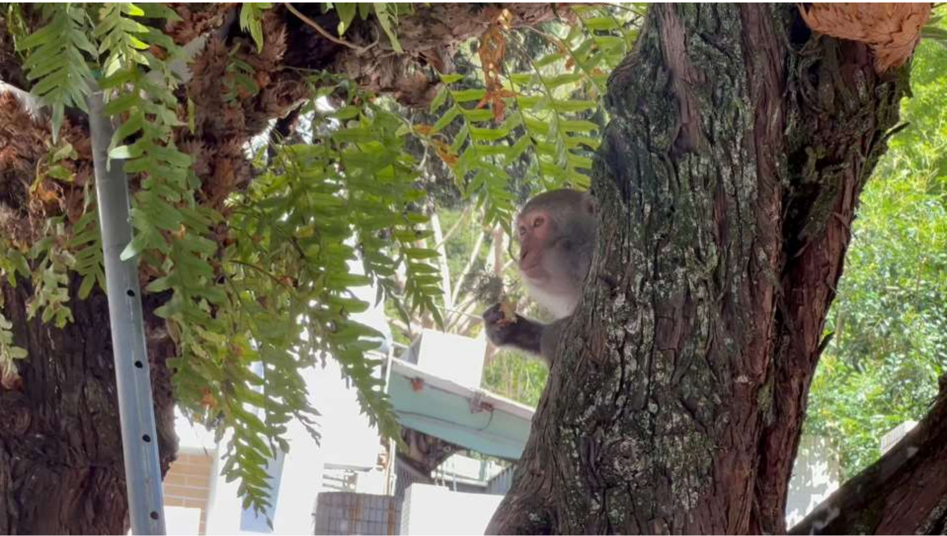
112年7月5日 搶食紅豆餅-二郎神