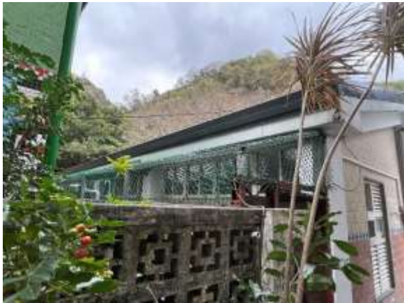
1. 資源回收室龜甲網