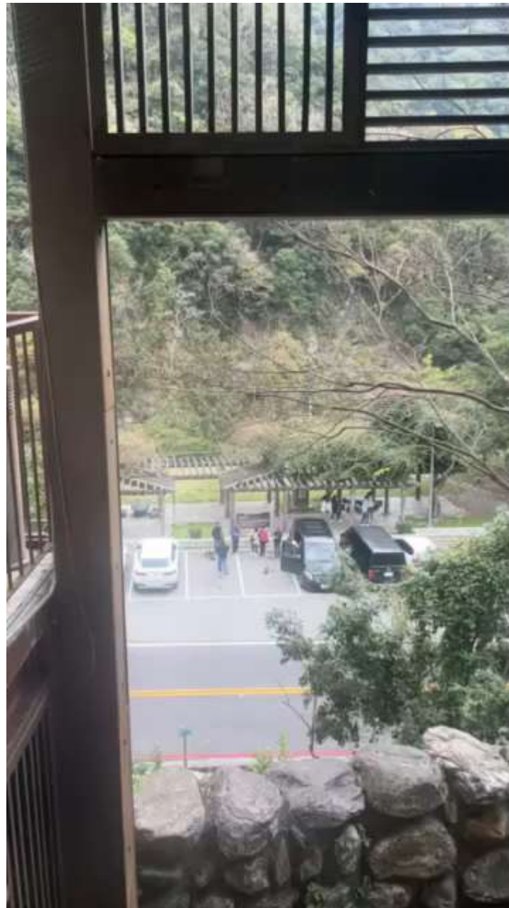
113年2月26日天祥郵局停車場