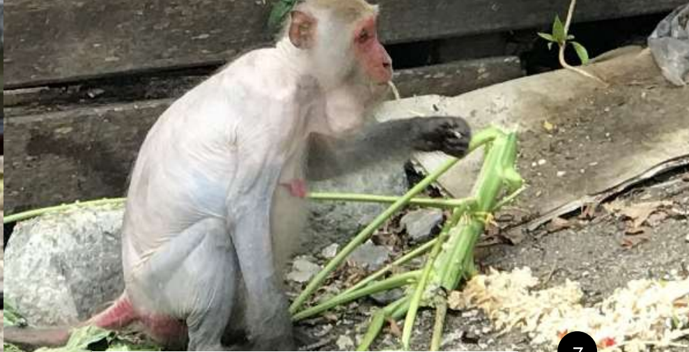
110年7月9日天祥餐廳後方