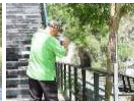
室內用餐空間不足 遊客於搶食熱點露天飲食