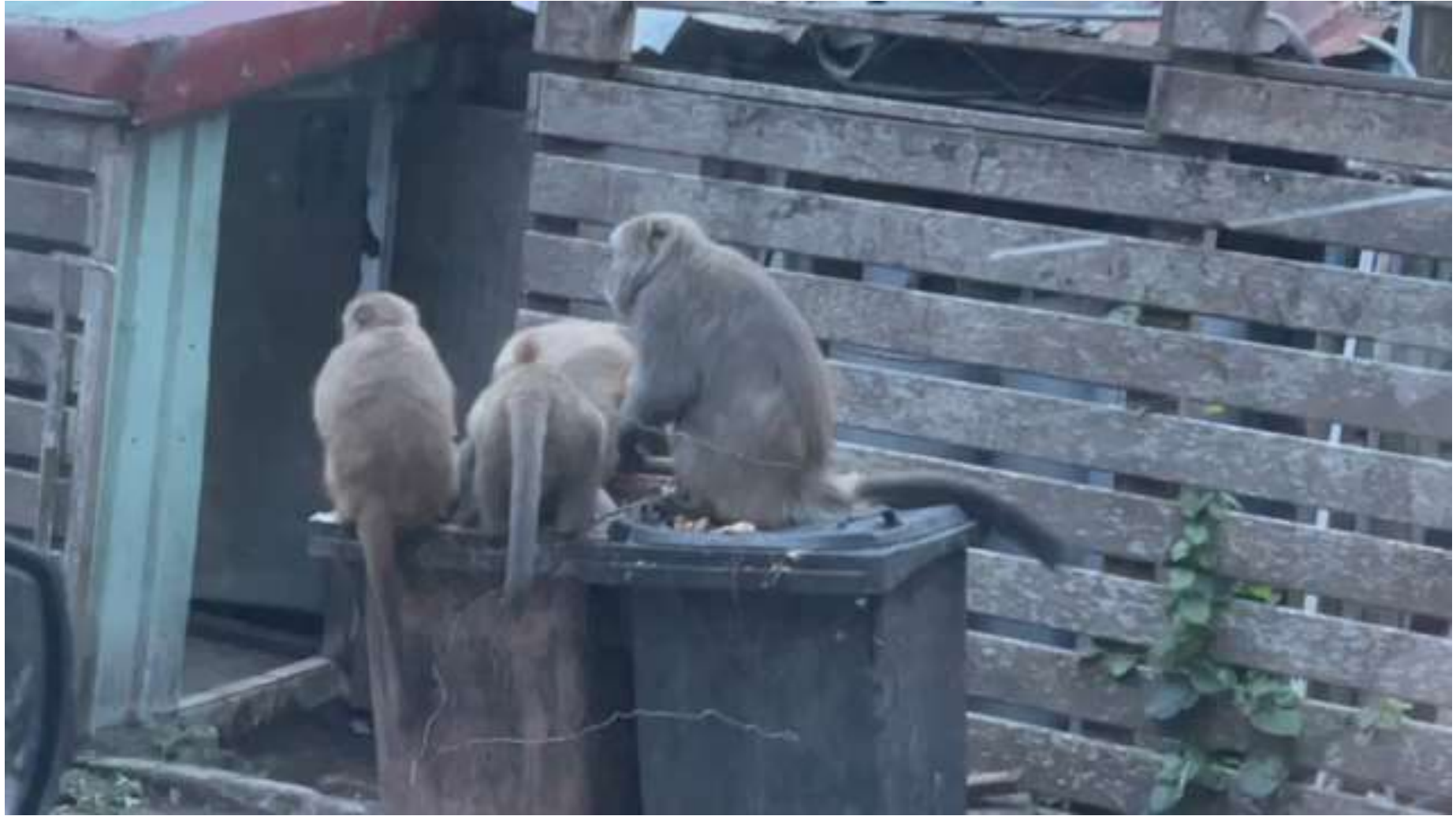
112年12月14日天祥餐廳後方 天祥猴群