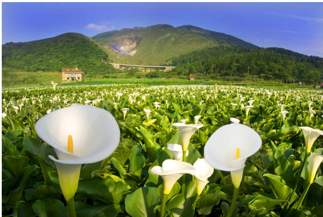
朵朵白色海芋盛開，是竹子湖一年中最美的季節，享受採摘海芋之樂

了解產業變遷歷程。最後可規劃於當地農家進行海芋園體驗，挽起袖子穿梭於海芋田間，享受採摘海芋的樂趣。