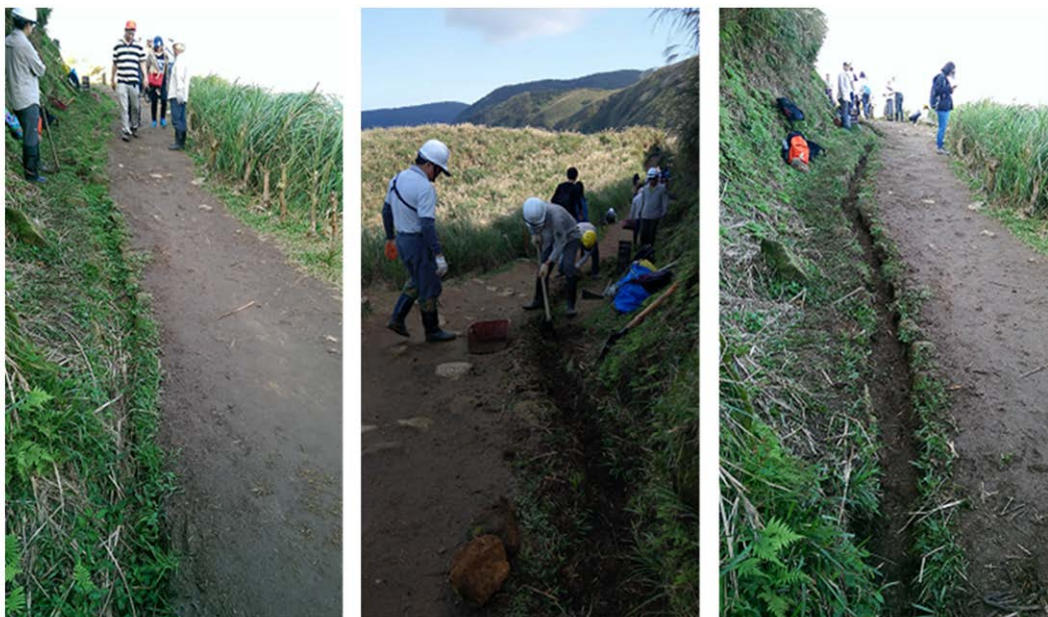
保育志工於日人路以手作步道方式維護步道(從左至右為施工前、中、後)

運用高科技航空測量測得 1 公尺網格的數位表面模型(DSM)數值資料，以 3D 彩色列印製作成立體模型，森林、草原、農田、建築物等細節一覽無遺，並細緻地呈現磺嘴山馬蹄型火山口；如果您走累了，還可以在媒體播放區欣賞陽明山國家公園的各類影片，包括優遊陽明山、陽明山建築風華、竹子湖畫說今昔、大屯火山的故事、蟲相逢、驚艷火山脈動、飛越臺灣國家公園等，深入瞭解陽明山國家公園的美。