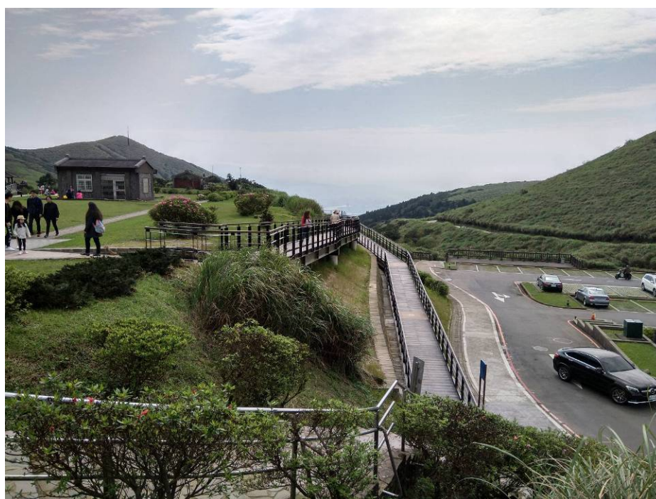
擎天崗無障礙坡道