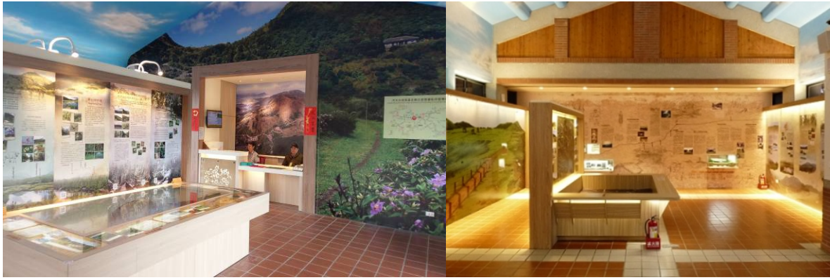
冷水坑遊客服務站及擎天崗遊客服務站展示更新後現況