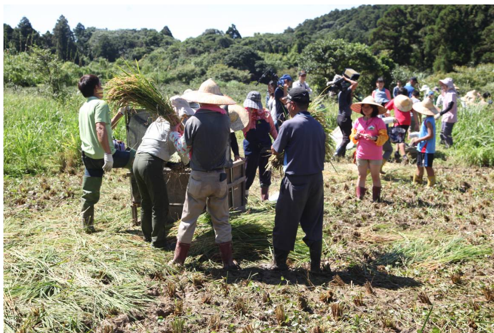
竹子湖蓬萊米復耕田收割季凝聚在地人的向心力