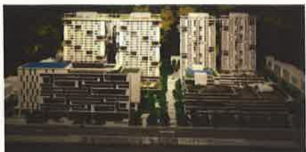
社會住宅模型(台北市廣慈博愛院基地公共住宅)