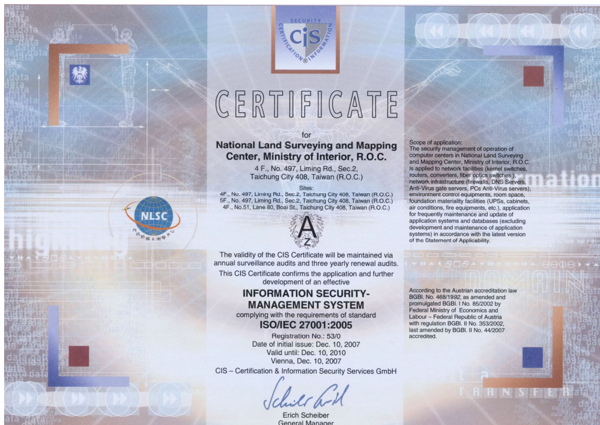
本中心獲得 ISO 27001:2005 證書