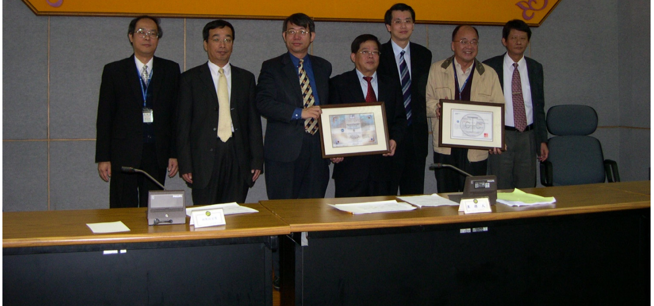
環奧公司、巨安公司代表與本中心林主任等人合影